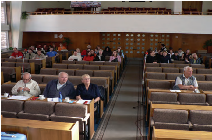
Seminář o problematice sluchově postižených