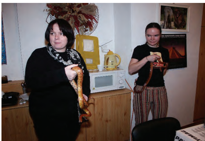
Užovky červené – náš první kontakt s hady