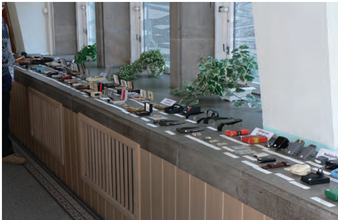
Historické kompenzační pomůcky pro sluchově postižené z výstavy na semináři