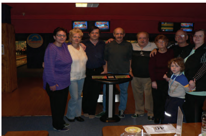
Vánoční turnaj v bowlingu Ústí n/L.