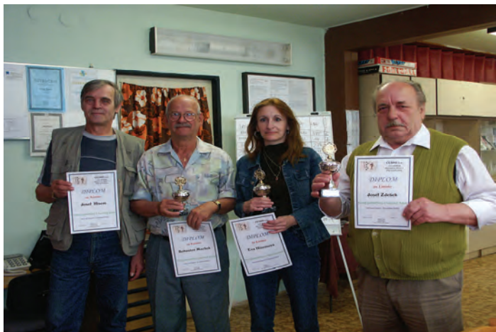
Podzimní turnaj v kartách Joker Hrálo 18 hráčů