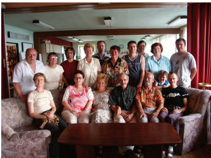
Letní turnaj Joker