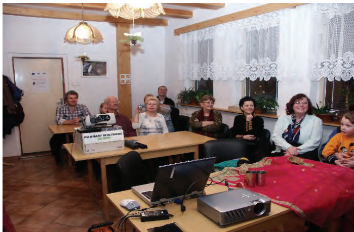
Naši členové na přednášce v ZOO Děčín